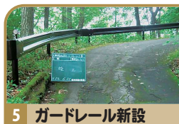
5 ガードレール新設