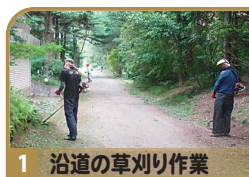
1 沿道の草刈り作業