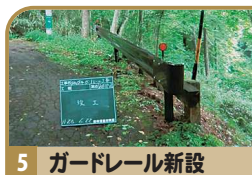
5 ガードレール新設