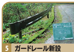
5 ガードレール新設