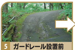
5 ガードレール設置前