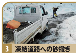
3 凍結道路への砂撒き